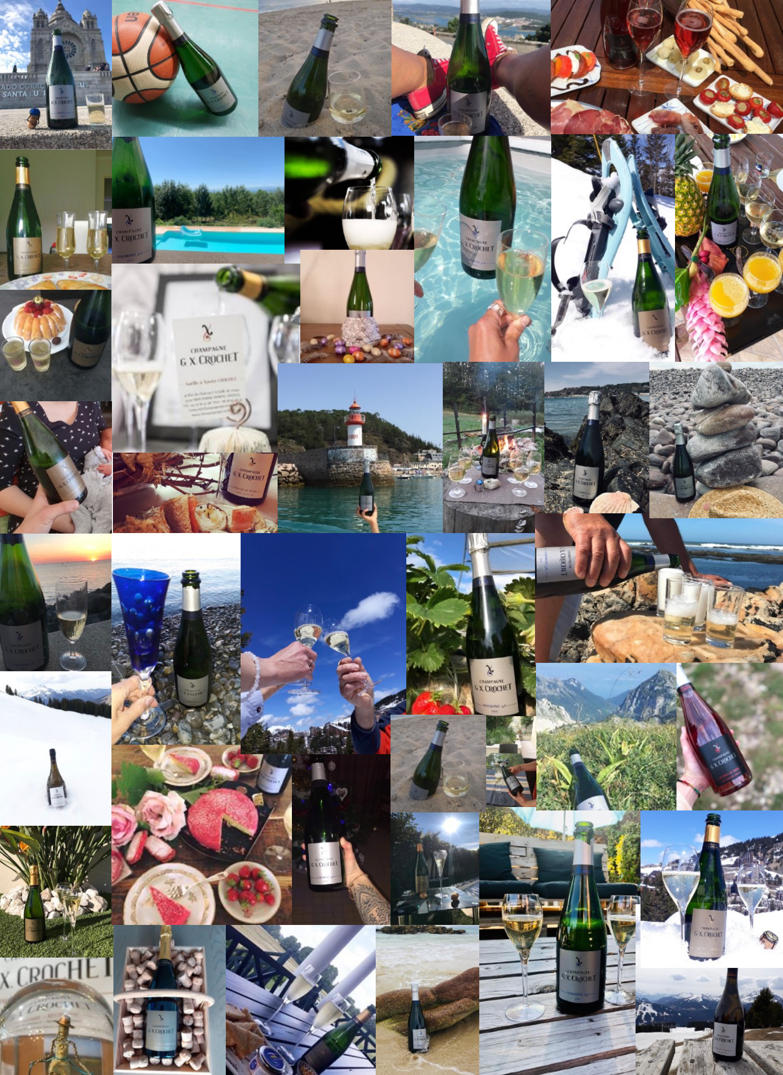
Notre Champagne vous accompagne ! Merci à tous pour ces photos !