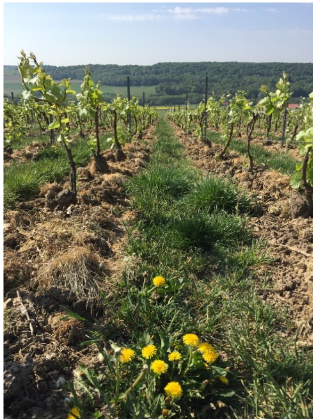
Parcelle La Fontaine de Boutavent, Bergères-sous-Montmirail, labour de printemps.

Les Laboureurs, Alphonse de Lamartine, Extrait